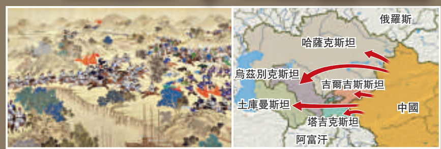
▲現時東干族人散居於哈薩克斯坦、吉爾吉斯斯坦、塔吉克斯坦等地。左圖為清宮廷畫師繪《陝甘回亂渭河戰圖》(局部)