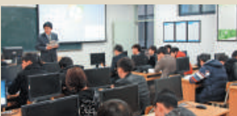
▲正在上課的東干族學生 劉俊海攝